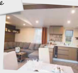
Le salon et la cuisine