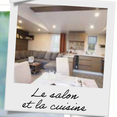
Le salon et la cuisine