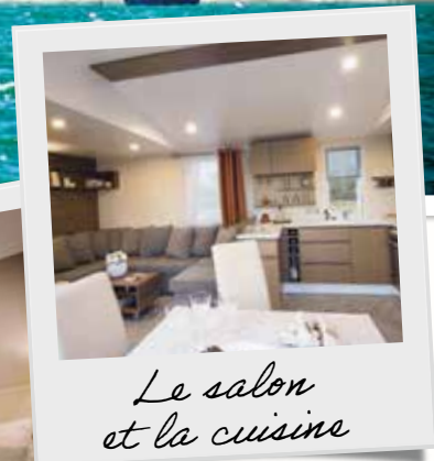
Le salon et la cuisine